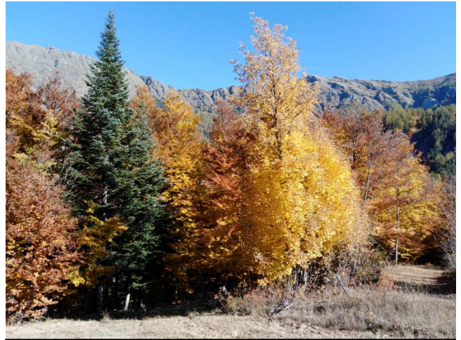
Les couleurs de l'automne dans le Champsaur

Activité : Randonnée Formation Orientation