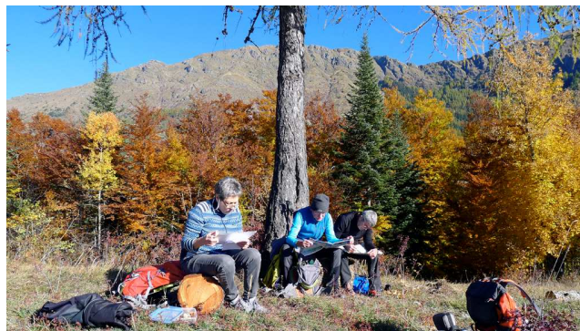
Pause studieuse au Col

Altitude de départ/arrivée/dénivelé cumulé : 1300m/ 1530m / 300m