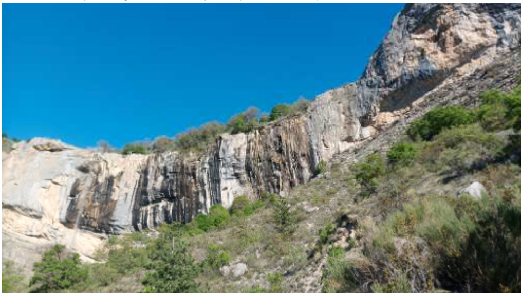
(1ère barre et la cascade)

Après s'être retrouvé au parking, on fait un petit point sur le parcours et on démarre vers 9h.