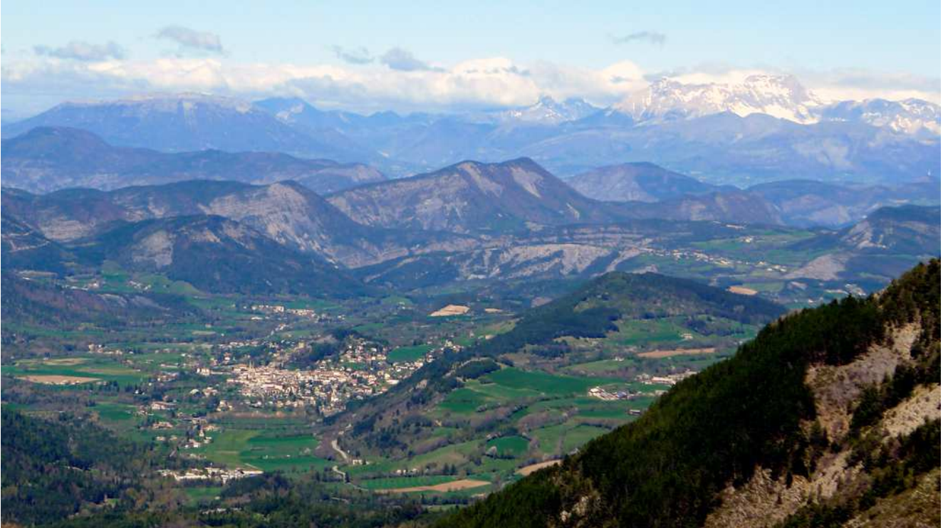
Du point haut, vue sur la vallée, le village de Seyne et au loin le Pic de Bure