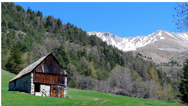
Une grange d'alpage

Au passage de la crête : vue sur la Cabane de Couloubroux et sur les sommets au dessus : de gauche à droite : l'aiguillette, la Col La Pierre, la Roche Close, le Pic des Têtes